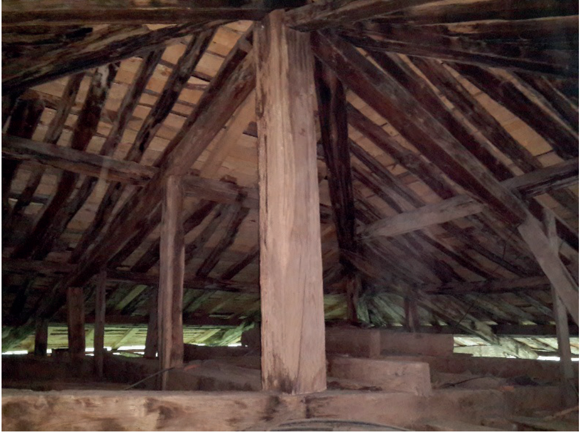
Fotoğraf-13: Çatının içeriden görünümü Caminin minaresi ve vaaz kürsüsü bulunmamaktadır.

Genel özelliklerini sunduğumuz caminin en temel karakteristiği, ahşap süsleme sanatıyla bezeli olmasıdır. Cami âdeta bir dantel gibi işlenmiştir. Özellikle kapı, mihrap, minber, müezzin köşkü, pencere kenarları ile sütunlar ahşap oymacılığının en narin örneklerine sahiptir. “Süsleme kompozisyonları geometrik ve nebati şekillerden müteşekkildir. Lale, Mühr-i Süleyman 5 , sepet örgü, çift sarmal kordon, rozet, yılankavi, kozalak, kıvrık dal, baklava dilimi, zik zak motifleri caminin sahip olduğu süs repertuarını oluşturan motiflerdir.” 6 Caminin söz konusu harika işlemleri kapı önüdeyken sizleri etkisi altına alır ve içeriye girmenizle birlikte farklı bir atmosferde olduğunuzu hissedersiniz.