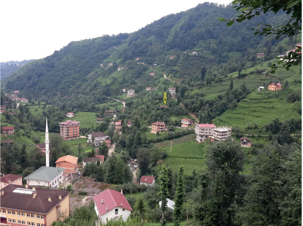
Fotoğraf -1: Dereyurt Köyü'nün genel görünümü. (Cami okla gösterilmiştir.)

İlçe tarafından köye girişte sol tarafta yer alan sıradağlar üzerinde Kılavuz (eski adıyla Muzgar) Köyü bulunmaktadır. Cami, bu köye giden dik meyilli yolun sol tarafında, Dereyurt Köyü'nün köyü gören en güzel yerindedir.