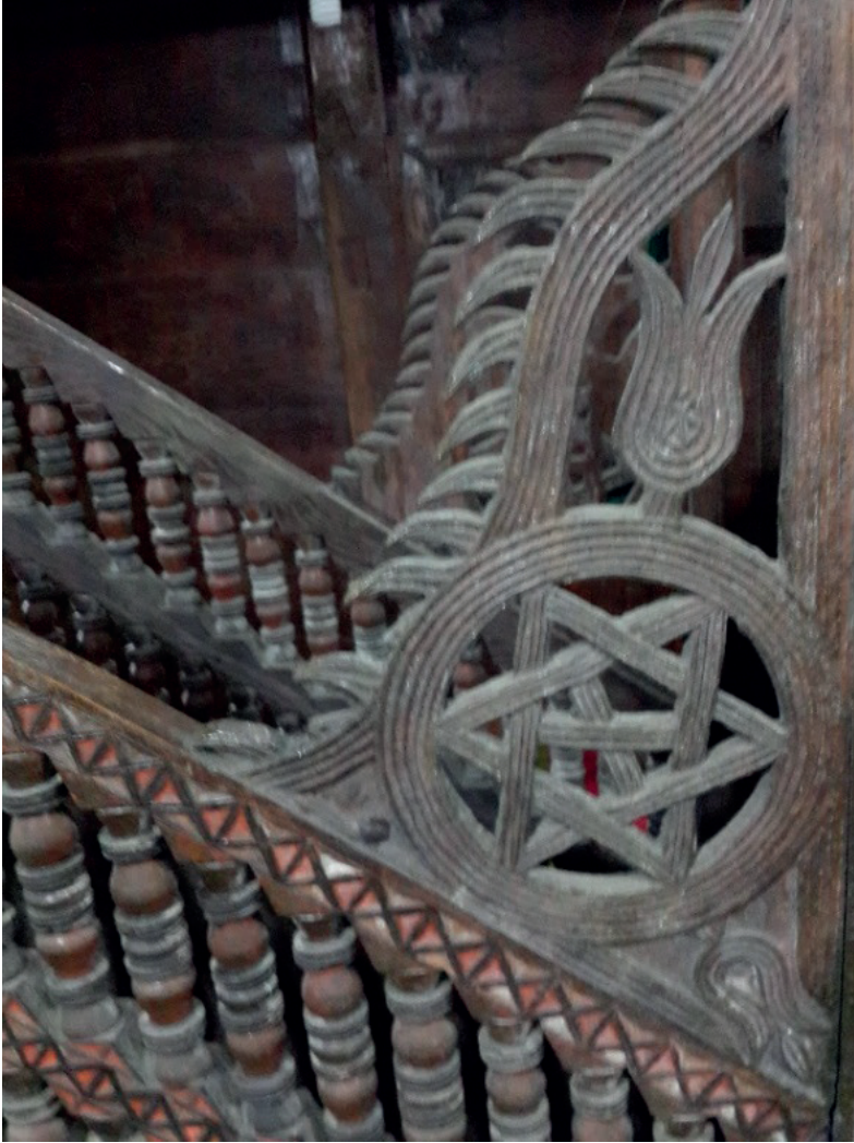
Fotoğraf-22: Minber kapısı ile doğu tarafı korkuluğunun birleştiği yerdeki motif

Aynı süsleme minberin batı tarafında da vardır. Ancak, burada ilginç bir görüntüyle karşılaşmaktayız. Süleyman mührünün üstünde lale motifi değil de kuş motifi vardır. Kuşun başı, gözü, gagası, kuyruğu, ayakları ve vücudu son derece belirgindir ve başka bir şeye benzetilmesi mümkün değildir. Cami içinde canlı figür yapılmış olması açısından bu manzara son derece ilginç bir durum arz etmektedir. Trabzon gibi İslâmî ilimlerde yetişmiş insan sayısının fazla olduğu ve halkın genel dini bilgisinin iyi düzeyde seyrettiği bir yörede cevaz verilmeyen bir uygulamanın yapılmış olması, sonrasında da bu motife dokunulmamış olması ilginçtir. 7