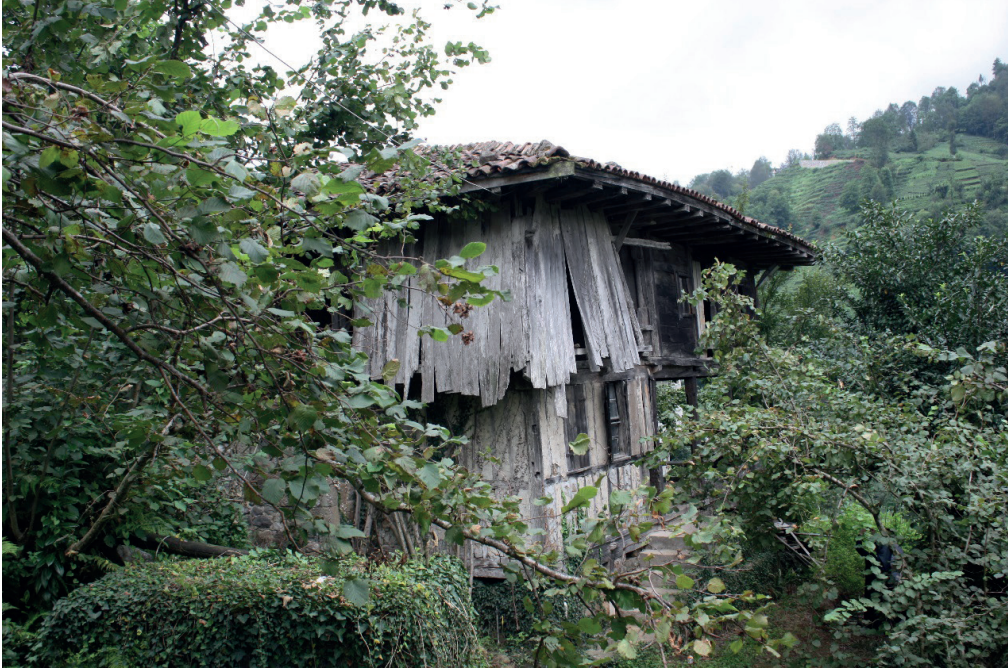
Fotoğraf-11: Mahfil katının batı cihetinde uzatılan kısmın boş alan olarak bırakılan bölümünün yağmur ve kardan korunması için tahtalarla kapatılmış hali

Caminin çatısı dört yöne eğimli (dört omuz kırma) ve yapıyı yağmurdan/kardan tamamen korumayı hedefleyecek şekilde geniş saçaklı olarak yapılmıştır ve alaturka (Osmanlı) kiremitle kaplıdır. Kiremitlerin bir kısmı yenilenmiştir.