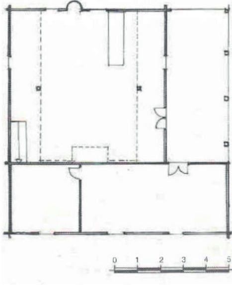
Fotoğraf-5: Caminin planı (Sümerkan ve Okman, Kültür Varlıklarıyla Trabzon, I/37 )