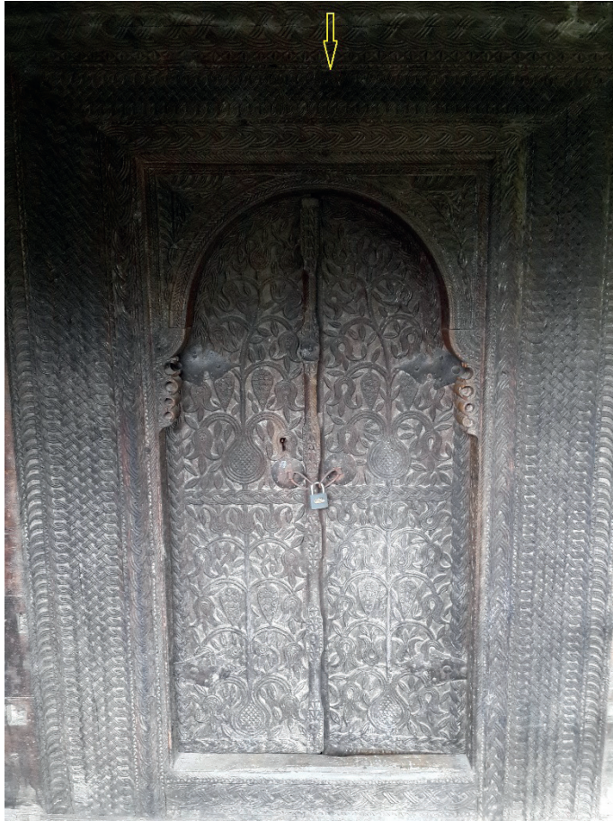
Fotoğraf -3: Harim kapısının üst sövesinde inşa tarihinin bulunduğu kısım okla gösterilmiştir.